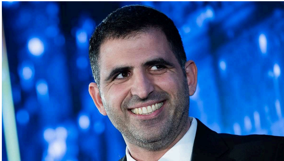
שר התקשורת שלמה קרעי