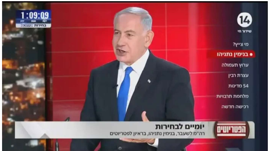
נתניהו בתוכנית הפטרוטיים, ערוץ 14 / צילום מסך, צילום מסך

מוקדם יותר היום הודיעה ועדת המדרוג כי כשלוש שנים אחרי שפרש ממנה, ערוץ 14 צפוי לחזור ולהימדד . על פי ההסכם, בקרוב תחל הוועדה לפרסם את נתוני הצפייה של הערוץ יחד עם שאר הערוצים.