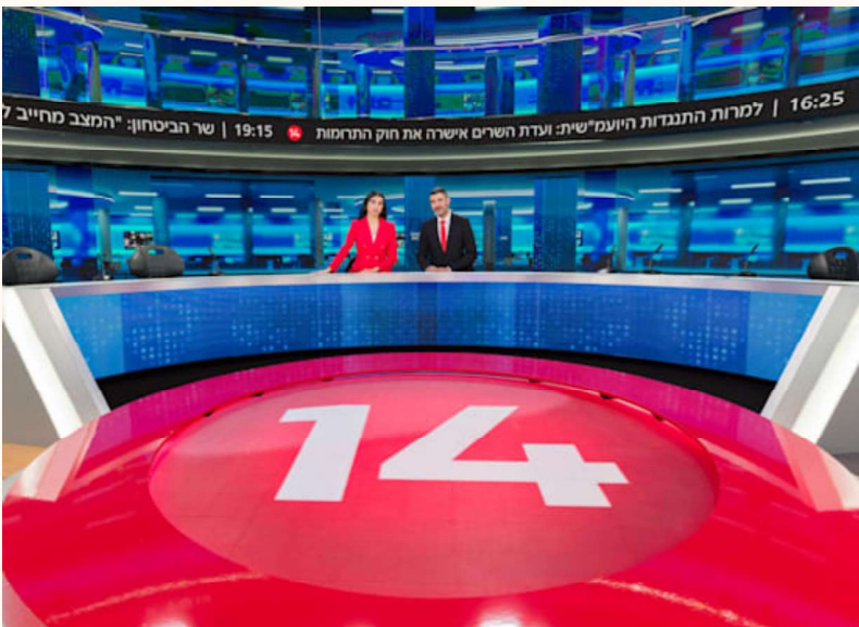
אולפן חדשות 14