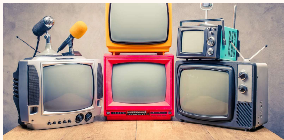
שוק הטלוויזיה