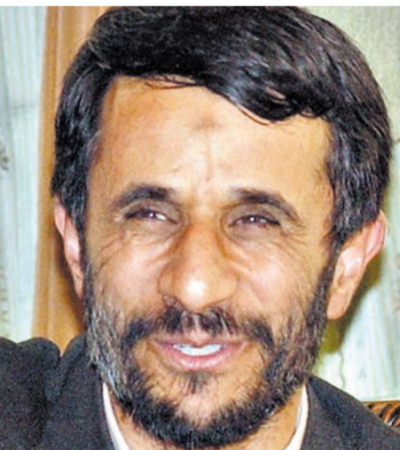
אחמדניג'אד. "צריך למועט את המטויה שלו"

"בוודאי שלא ניצחנו. היעדים שהממשלה הציבה למלחמה לא הושגו. לא פירוק החמאס ולא ברם מצפון לדרום עם כוחות גדולים מאוד, עם הרבה שריון, ולשלב כוחות נוספים במתקפה. זו התוכנית הבסיסית, שאני חשבתי, אני מוכרח לה־גיד שהייתי משובכע, שהממשלה תבצע. אם היו תוקפים כך, אני לא בטוח שבסוף המהיר שהיינו רים מהלך לקי. התחושה שלי התחזקה עוד יותר כשאני שומע שהתנהלו שיחות היכרות עם חתק בריס בהיעדר פרוטוקולים, בהיעדר הרבר החשוב "אני חושב שהתקיפה מהאוויר הייתה חשובה והכרחית. היא גם ניטרלה את הטילים שמעבר לליטאני, את המשגרים ארוכי הטווח, וזה אולי ההישג הצבאי היחיד של המערכה הזו, הישג מור־דיעני וצבאי, אבל זה היה כמובן מאוד חלקי. עיקר הקרטות היו מדרום לליטאני וללא משגרים ארוכי טווח. זה היה עיקר הכוח של חיובאללה וכדי לנצח