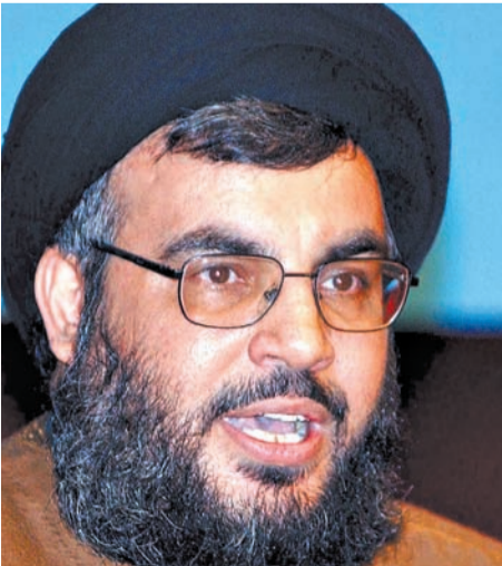
נסראללה. "נתתק אותו מאיראן, והוא לא קיים"

כוד אותם בקופסה, קופסת מוות שאין ממנה מוצא עבורם. אחר כך היינו צריכים להתחיל לנוע לע־ברם מצפון לדרום עם כוחות גדולים מאוד, עם הרבה שריון, ולשלב כוחות נוספים במתקפה. זו התוכנית הבסיסית, שאני חשבתי, אני מוכרח לה־גיד שהייתי משובכע, שהממשלה תבצע. אם היו תוקפים כך, אני לא בטוח שבסוף המהיר שהיינו רים מהלך לקי. התחושה שלי התחזקה עוד יותר כשאני שומע שהתנהלו שיחות היכרות עם חתק בריס בהיעדר פרוטוקולים, בהיעדר הרבר החשוב "אני חושב שהתקיפה מהאוויר הייתה חשובה והכרחית. היא גם ניטרלה את הטילים שמעבר לליטאני, את המשגרים ארוכי הטווח, וזה אולי ההישג הצבאי היחיד של המערכה הזו, הישג מור־דיעני וצבאי, אבל זה היה כמובן מאוד חלקי. עיקר הקרטות היו מדרום לליטאני וללא משגרים ארוכי טווח. זה היה עיקר הכוח של חיובאללה וכדי לנצח