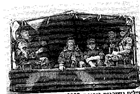
חיילים גיאורגים בנסיגה, 2008. הגיאורגים אינם מבינים איך מי שתנך בהם תומך כעת באויביהם