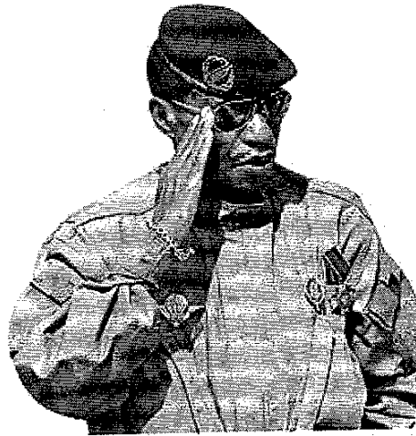
הנשיא קאמרה, שתפס את השלטון בהפיכה