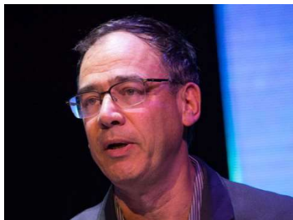
ניצן. גיבוי לחוקרים

יואב יצחק • מו"ל ועורך ראשי • News1 דוא"ל • בלוג/אתר • רשימות • מעקב