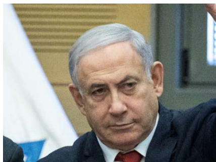
נתניהו. חפץ נכחט

ניר חפץ הוא עד מפתח בשלושת תיקי נתניהו - סחיטתו באיומים מטילה צל כבד על תוכן עדותו - שי ניצן נותן גיבוי לחוקרי המשטרה למרות שנקטו אמצעים בלתי חוקיים נגד ניר חפץ כדי לסחוט ממנו מידע ו/או הצהרות - היועמ"ש מנדלבליט הגיב שהוא לא ידע ולא אישר פעולות אלה - המידע הסנסציוני הוצג במהלך השימוע על-ידי פרקליטיו של נתניהו אך היועמ"ש נמנע עד כה מהנחיה לחקור פרשה זו