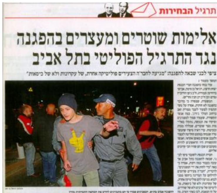
"הארץ", עמוד 6, 9 במאי 2012

לעומת זאת, ההפגנה ב-12 במאי, אשר התאפיינה בריבוי מסרים ובניסיון לייצר שיח אחר וחדש, מוסגרה כמבולבלת ומפוזרת. כך למשל, אמרה כותרת בעמוד הראשון של העיתון ב-13 במאי: