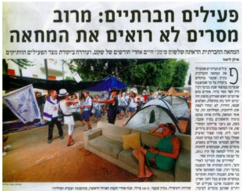
"הארץ", עמוד 8, 14 במאי 2012

מעבר להבדל זה בסיקור שתי ההפגנות, "הארץ" גם העביר מסר בנוגע לעמדות שאותן צריכה המחאה לאמץ, לדעתו – עמדות המייצגות את הצד השמאלי במפה. מסר זה הופיע שוב ושוב בטורי הדעה בעיתון. כך למשל, מחה מאמר המערכת של העיתון, שפורסם בעמוד 2 ב-2 במאי תחת הכותרת קלקלת בחירות , על האפליה שנוקטת ממשלת נתניהו בין מפגיני הקיץ שעבר, שלהם לא נמצאו פתרונות דיור, לבין מפוני המאחז הבלתי חוקי מגרון, שבפתרון בעיית הדיור שלהם השקיעה הממשלה 53 מיליון שקלים. הטור מסתיים במסקנה ברורה: