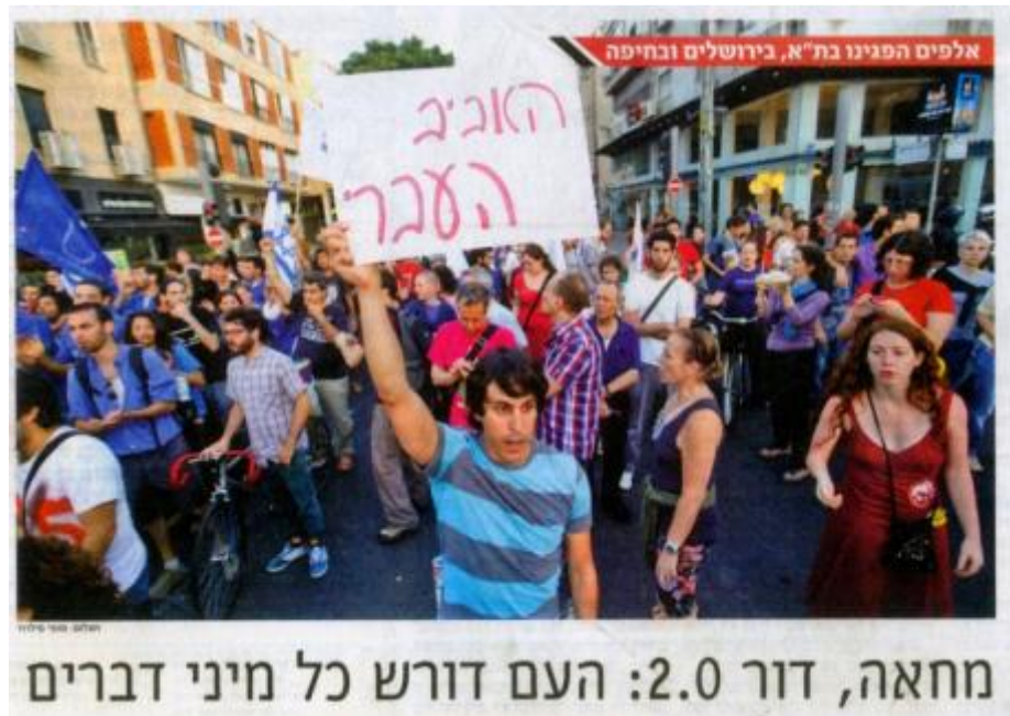
"הארץ", עמוד 1, 13 במאי 2012

גם היחס השונה לטענות לגבי אלימות משטרתית נגד המפגינים בשני האירועים מעיד על עמדה ערכית שונה של העיתון ביחס לכל אחד מהם: לאחר ההפגנה הראשונה העלה "הארץ" את נושא האלימות המשטרתית לראש סדר היום, כפי שמראה הכותרת בעמוד הראשון של הגיליון ב-9 במאי, שצוטטה קודם לכן; לעומת זאת, לאחר ההפגנה השנייה נאמר ב"אותיות הקטנות" של הידיעה שהתפרסמה בעמוד 3: "כן, השוטרים פשטו אמש, כמו בכל הפגנה ישראלית, הרבה יותר מדי. אבל אתמול הם לפחות לא היו אלימים, לשם שינוי". העובדה כי באותה הפגנה נעצרו 10 מפגינים דווחה רק בשורה אחת, בתוככי ידיעה סמוכה, תחת הכותרת מירושלים דרך מדריד ועד לונדון , שדיווחה על הפגנות נוספות בארץ ובעולם.