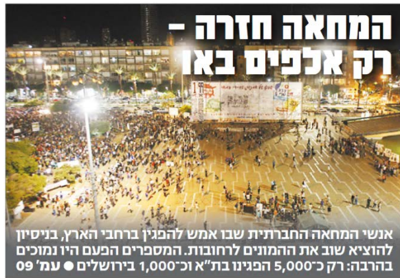
אנשי המחאה החברתית שבו אמש להפגין ברחבי הארץ, בניסיון להוציא שוב את ההמונים לרחובות. המספרים הפעם היו נמוכים בהרבה: רק כ-5,000 הפגינו בת"א וכ-1,000 בירושלים • עמ' 9