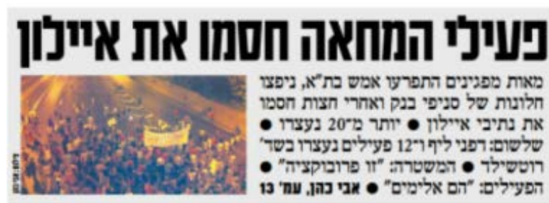
"ישראל היום", עמוד 1, 24 ביוני.

ב"ישראל היום" הופיעו הטענות כי המשטרה היא שהפעילה אלימות מיותרת רק בסיפא של כותרת הידיעה בעמוד הראשון, בשתי מילים בלבד, לאחר התיאור העובדתי כי מאות מפגינים התפרעו והמשטרה: זו פרובוקציה . כותרת הידיעה בעמוד הפנימי, עמוד 13, הייתה: מחאה אלימה בת"א, המשטרה: פרובוקציה . כותרת המשנה עסקה בעיקר במטרד שיצרו המפגינים ובאלימותם בקובעה כי המפגינים ניסו לפרוץ לסניפי בנקים . בכך הפכה הכותרת מעשה ונדלזים של שבירת שמש לפשע של פריצה לבנק והעלטה קונוטציות של גניבת כסף.