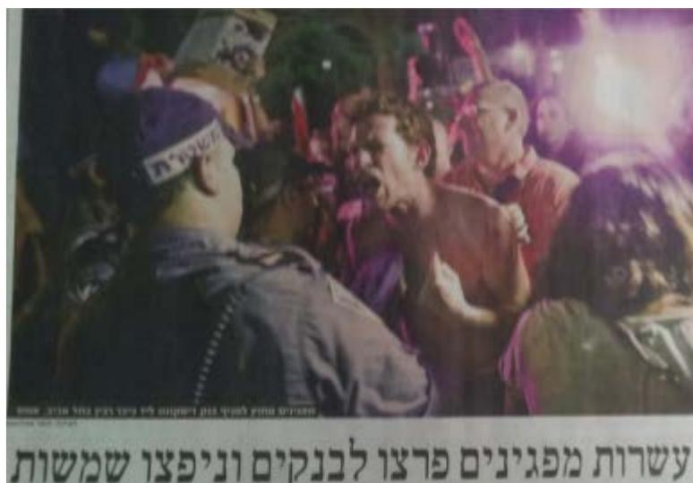
"הארץ", עמוד 1, 24 ביוני

גם ב"הארץ", שעד אז נטה, כאמור, לסקר באופן אוחד את המחאה, קבעה הכותרת הראשית: עשרות מפגינים פרצו לבנקים וניפצו שמשות . הכותרת לא כללה אזכור לטענות בדבר אלימות משטרתית, אף שאלו הופיעו בידיעה עצמה, שפורסמה בעמוד 5. ביקורת על האלימות המשטרתית הופיעה במאמר המערכת של העיתון ובמאמר דעה, אך הידיעות החדשותיות, הנתפסות כאובייקטיביות ועובדתיות ולכן להן השפעה מיוחדת, נתנו ביטוי בעיקר לעמדת המשטרה, על פיה ההפגנה הייתה לא חוקית והמפגינים התפרעו באלימות. בה בעת, ניתן ביטוי נרחב יחסית גם לעמדת המוחים לגבי דרישתם לצדק חברתי, זכותם להפגין ותלונותיהם כי המשטרה הפעילה אלימות שלא לצורך.