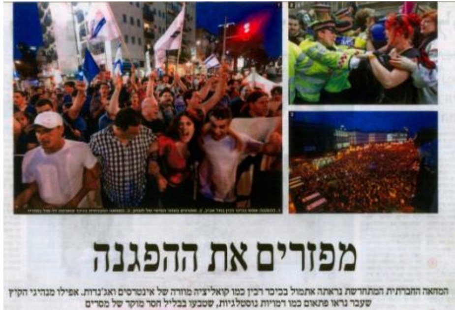
"הארץ", עמוד 3, 13 במאי 2012