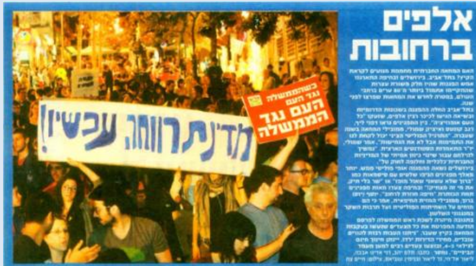
"ידיעות אחרונות", עמוד 10, 13 במאי 2012

כך, ב"ידיעות אחרונות" אשר הציג מסגור דומיננטי התומך במחאה, פרסם תמונה מזווית צילום קרובה ונמוכה, היוצרת תחושה של הזדהות וקרבה – ובה רואים כיכר המלאה באנשים. הכותרת שליוותה את התמונה אמרה אלפים ברחובות . "ישראל היום" שנטה להציג את המחאה באור שלילי, מה שבא לידי ביטוי בין השאר בהצגת מספר המשתתפים בהפגנות כמספר קטן, המעיד על כישלון המחאה, בחר לפרסם תמונה של איזור ריק בכיכר, בתצלום רחוק היוצר תחושת זרות. הכותרת שהתלוותה לתמונה זו הייתה המחאה חזרה – רק אלפים באו .