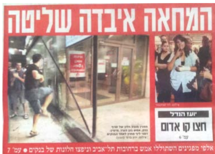
"ידיעות אחרונות", עמוד 1, 24 ביוני

כך למשל קבע "ידיעות אחרונות" בכותרתו הראשית כי המחאה איבדה שליטה , ובכותרת נוספת באותו העמוד כי המפגינים חצו קו אדום :