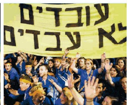
"מעריב", 6 במאי, עמוד 6