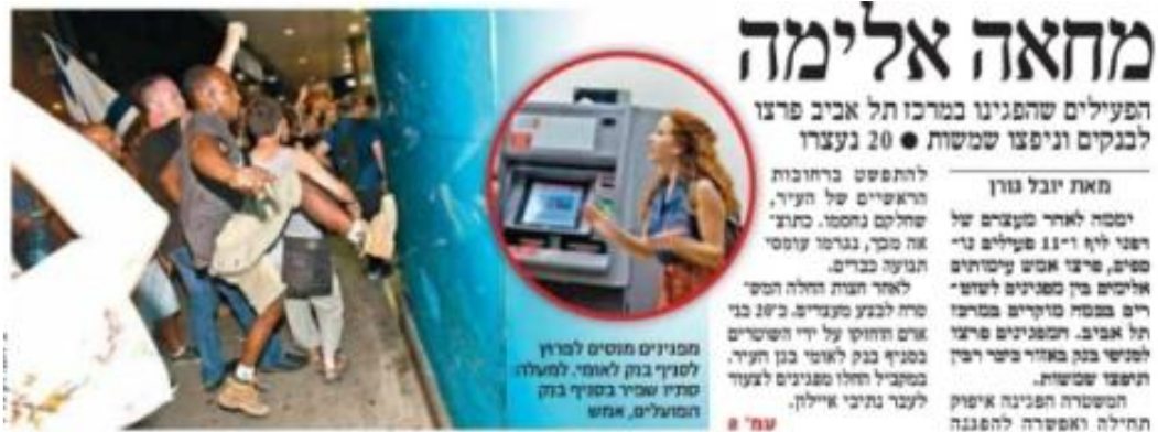
"מעריב", עמוד 1, 24 ביוני.

גם ב"הארץ", שעד אז נטה, כאמור, לסקר באופן אוחד את המחאה, קבעה הכותרת הראשית: עשרות מפגינים פרצו לבנקים וניפצו שמשות . הכותרת לא כללה אזכור לטענות בדבר אלימות משטרתית, אף שאלו הופיעו בידיעה עצמה, שפורסמה בעמוד 5. ביקורת על האלימות המשטרתית הופיעה במאמר המערכת של העיתון ובמאמר דעה, אך הידיעות החדשותיות, הנתפסות כאובייקטיביות ועובדתיות ולכן להן השפעה מיוחדת, נתנו ביטוי בעיקר לעמדת המשטרה, על פיה ההפגנה הייתה לא חוקית והמפגינים התפרעו באלימות. בה בעת, ניתן ביטוי נרחב יחסית גם לעמדת המוחים לגבי דרישתם לצדק חברתי, זכותם להפגין ותלונותיהם כי המשטרה הפעילה אלימות שלא לצורך.