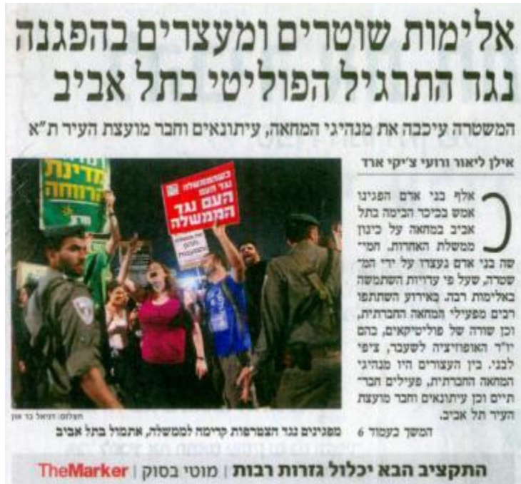
"הארץ", עמוד 1, 9 במאי 2012