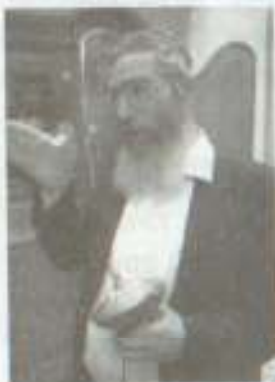
הרב ישראל אריאל

המקדש מוזיאון של כלי מקדש, בשמים, בגדי כהן ועוד. המכון מקבל מימון של המדינה (ממשרד החינוך וממשרד הדתות) ועזרה מצד בנות שירות לאומי. מפעיליו מאשרים כי הם מקבלים תרומות גם מגופים פונדמנטליסטים נוצריים.