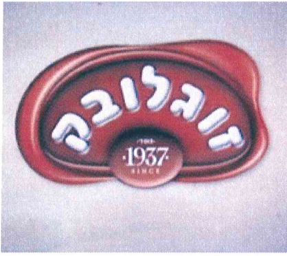
סמליל חברת זוגלובק