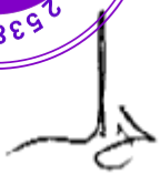
גילת שלו, שופטת