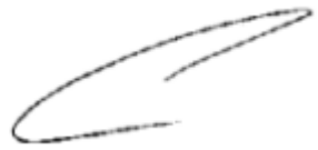
יואל עדן, שופט