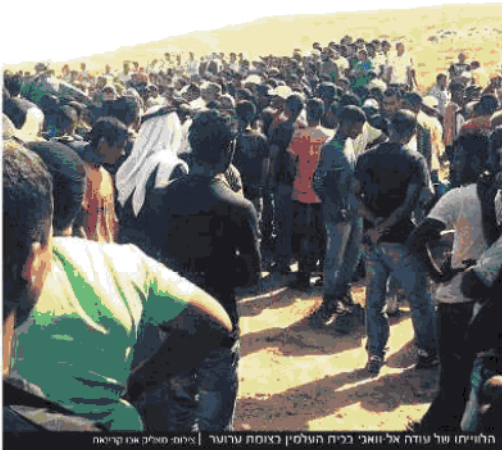
הלחימה של עודה אל-וואג' בבית העלמין כאמת ערנור | איים-מילק און קריאה

תן של בנות משפחה אל-ווקילי. שרים ביקרו את אלו"ר ומראם, והפיצו את התמונות לתקשורת. זיל ביפת ברזל שעולה 50 אלף דולר היה אמור להציל את עורה אל-וואג' מחמורת. את המיל הזה משגרים כאשר יש סיכוי שהוא ייפול באזור מאוכבלם.