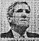
ברק אובאמה, נשיא ארצות הברית

נשיא ארצות הברית ברק אובאמה הודיע היום כי יתפטר מראשות הממשלה אם יתברר כי הוא מעורב במתן היתר לרצח. אובאמה הודיע כי יתפטר מראשות הממשלה אם יתברר כי הוא מעורב במתן היתר לרצח.