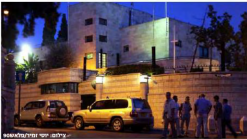
לפני: הבית, מוזנח, מתקלף, שבור, שמוט ואומלל - מי בכלל רוצה לגור בכזה מקום??