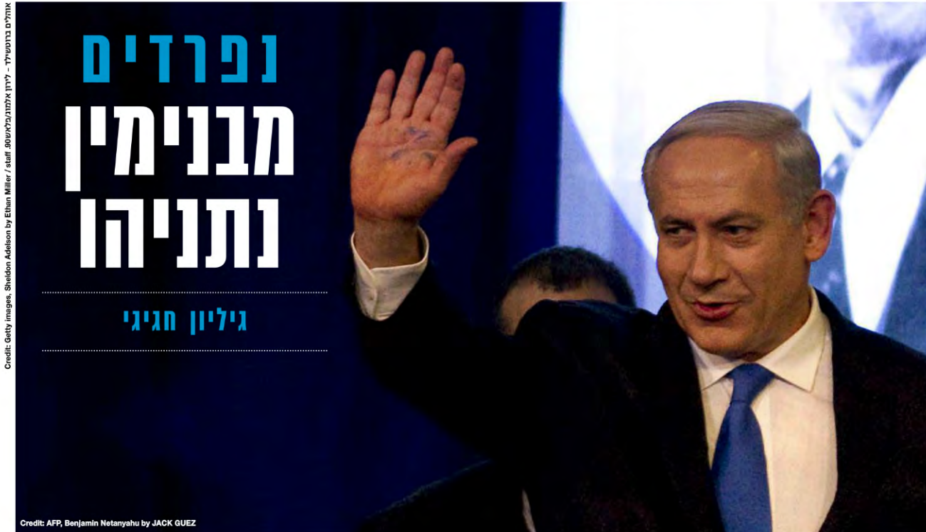
אחילים ברוסטרל - לירון אלמנטרל/ש. 30, staff / Miller / Getty Images