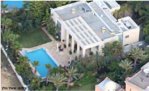
אחרי: מרחבים, בריכה, ריחוט גן חדש דגוש, ולא צריך כל הזמן לנסוע לירושלים - תענוג!!